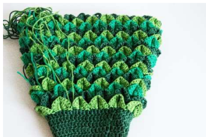
Blätterreihen, jede Runde in separater Farbe