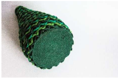
fertiger Baum mit Bodenplatte

Diese Bodenplatte noch 2 x in rot für den Standfuß des Baumes häkeln.