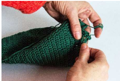
Arbeit um 180 Grad drehen und um das folgende Stb. wieder 5 Stb häkeln