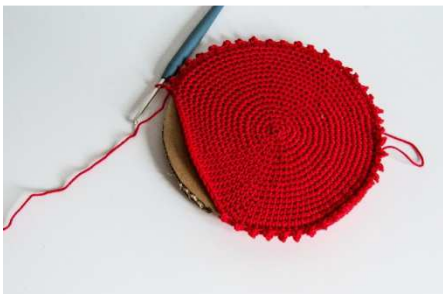
Standplatte für den Baum: 2 Bodenplatten zus.häkeln

Diese beiden Platten zusammen mit einer weiteren Pappscheibe im 15 cm Durchmesser zusammenhäkeln wie folgt: *2 f M, 1 Picot (= 3 L M, 1 Kettm. in die 1. LM). Ab * wdh.