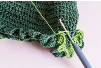
2. Blätter-Reihe in laub