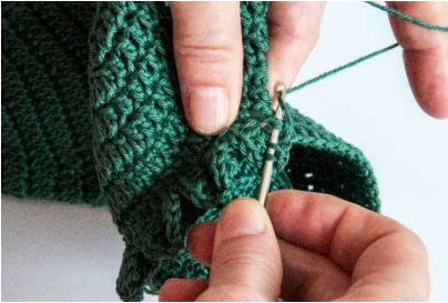
Stäbchen im 90 Grad Winkel um 1 Stb häkeln

Da ja die Grundform fortlaufend gemindert wird, werden die Blätter nicht grundlegend immer „auf Lücke“ gearbeitet werden können.