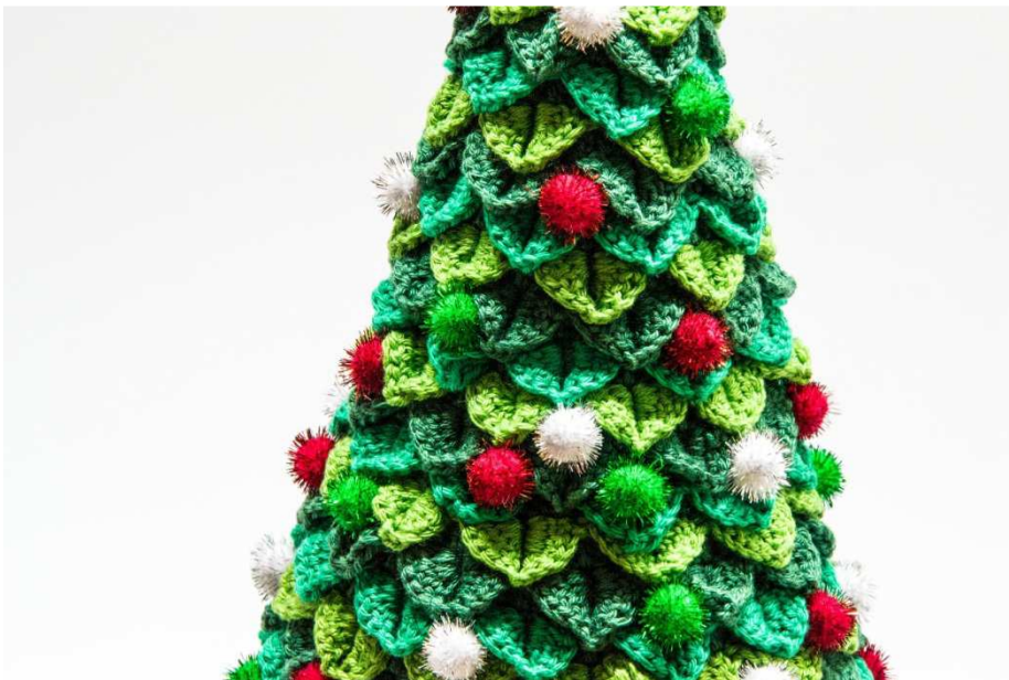
Metallic Pompons am Weihnachtsbaum fixiert

Die Metallic Pompons gleichmäßig verteilt auf dem Weihnachtsbaum festnähen.