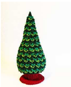
Stamm mit Standplatte an Bodenplatte des Weihnachtsbaumes fixiert

Die Metallic Pompons gleichmäßig verteilt auf dem Weihnachtsbaum festnähen.