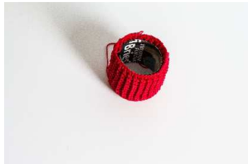
Stamm mit einer Innenrolle aus festerem Papier