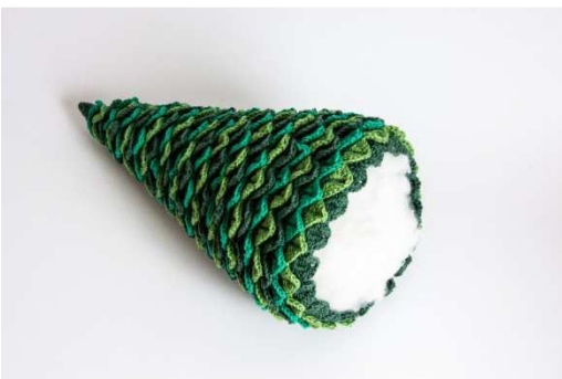
Weihnachtsbaum mit Füllwatte ausstopfen

Alle Modelle, Zeichnungen und Bilder stehen unter Urheberschutz. Eine Verwendung, die über die private Nutzung hinausgeht, ist ohne Zustimmung der Schoeller Süssen GmbH nicht gestattet.