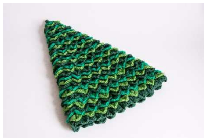
Alle Stäbchenrunden sind mit Blätter-Runden belegt.