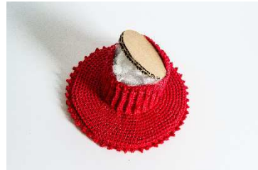
Stamm auf Standplatte festgenäht, mit Füllwatte gestopft und mit Pappscheibe gedeckelt