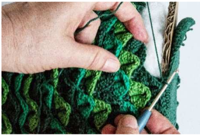
Pappscheibe mit der Bodenplatte an den Baum-Korpus häkeln

Die Pappscheibe einsetzen und die grüne Bodenplatte an den Kanten unter dem Weihnachtsbaum festhäkeln.