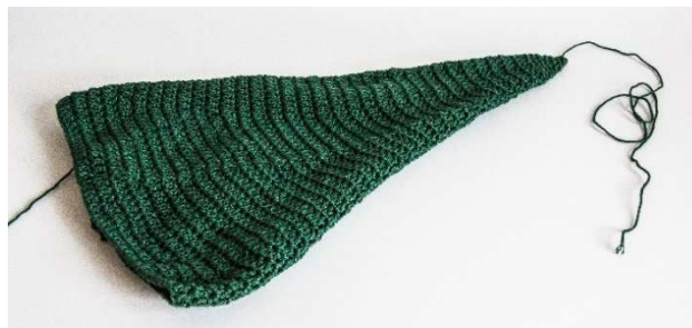
Kegel-Grundform für den Weihnachtsbaum

Den Faden durch die äußeren M-Glieder der Runde ziehen, fest zusammenziehen und innen vernähen.